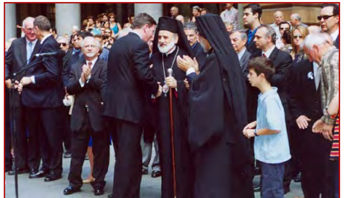
Στιγμιότυπα από τις Έορταστικές εκδηλώσεις επί τη έπετειώ της Έθνικής μας Παλιγγενεσίας. Η είθισμένη Δοξολογία χοροστατούντος του Σεβ. Αρχιεπισκόπου μας κ.κ. Στυλιανού εις τόν Καθεδρικό Ναόν του Ευαγγελισμού Redfern, παρουσία των Προξενικών, Πολιτικών και Διακοινοτικών Αρχών, ή επίμνημόσυνος δέησις και ή κατάθεσις στεφάνων στό Martin Place (27-3-04).

cannot survive if decision-makers on the international scene today prefer to support economic and strategic growth and consumerism , rather than ethical , cultural and spiritual development.