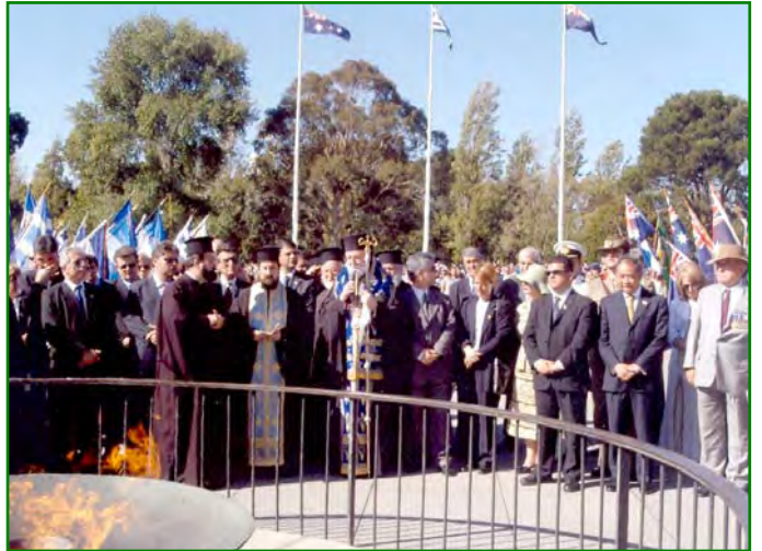
Στιγμιότυπον από τό Τρισάγιον εις τό μνημειον του Άγνώστου Στρατιώτου κατά τήν Έθνικήν μας Έορτήν 25ης Μαρτίου εις Μελβούρνην (28-3-04).