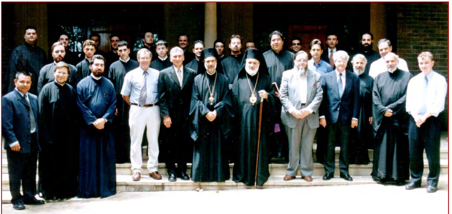
Ἀναμνηστική φωτογραφία τοῦ Σεβασμιωτάτου Ἀρχιεπισκόπου Αὐστραλίας κ.κ. Στυλιανοῦ, Κοσμητῶρος τῆς Θεολογικῆς Σχολῆς τοῦ Ἀποστόλου Ἀνδρέου, μεθ' ὅλων τῶν Διδασκόντων καί Διδασκομένων ἐν αὐτῇ, ἐπ' εὐκαιρίᾳ τῆς ἐνάργεως τοῦ Νέου Ἀκαδημαϊκοῦ Ἔτους 2004.

With fervent prayers in the Risen Christ Archbishop STYLIANOS