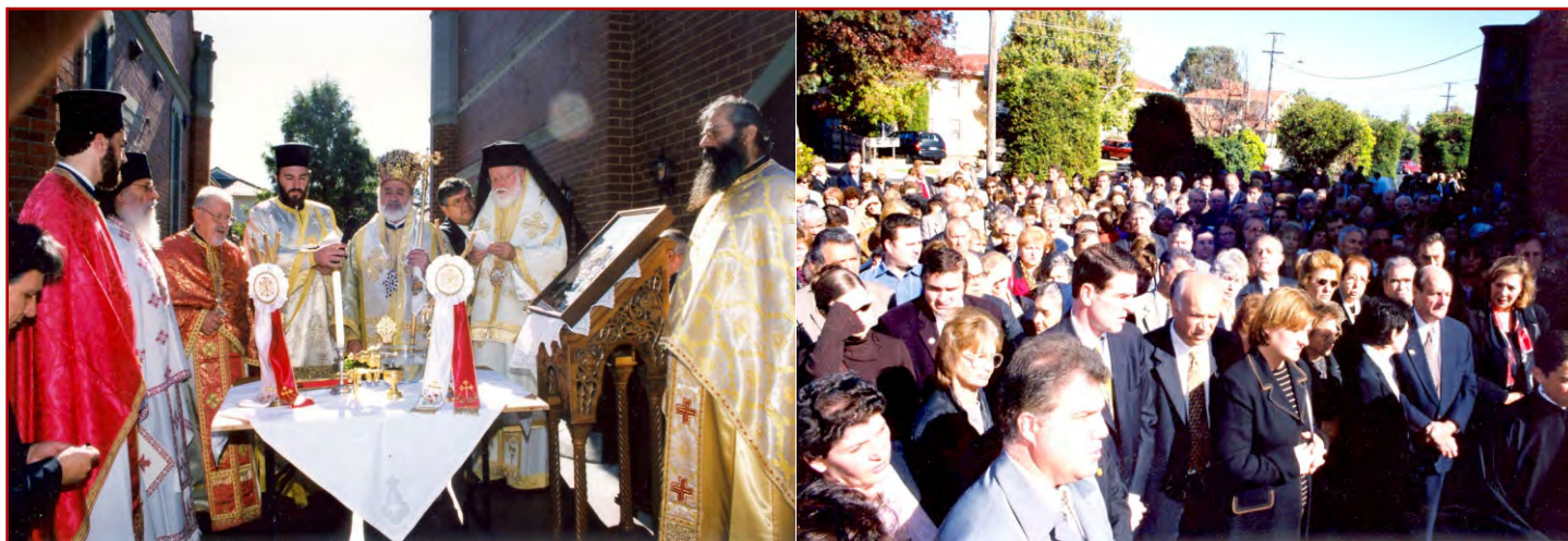
Ἀπὸ τὸν Ἁγιασμόν τῶν Θυρανοξίων τοῦ Ἑνοριακοῦ Κέντρου τῶν Ἀγ. Ραφαήλ Νικολάου καί Εἰρήνης Bentleigh Vic. (Κυριακὴ 4-5-003).