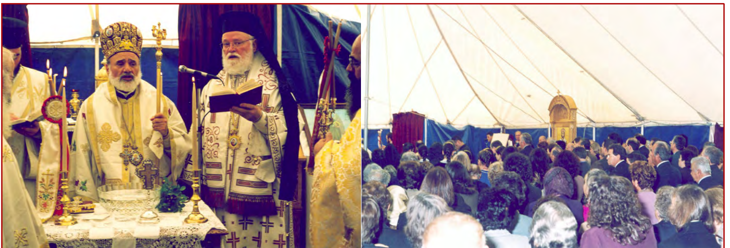
Στιγμιότυπα ἀπὸ τόν Ἅγιασμό τοῦ Θεμελίου λίθου τοῦ Ἱεροῦ Ναοῦ τοῦ Ἁγίου Νικολάου Yarraville Vic. (Κυριακῆ 25-5-03).

–Συνοδεύων τόν Σεβασμιώτατον, παρέστη εἰς τήν κηδείαν τοῦ ἀείμνηστου Ἀρχιμ. Ἰεζεκιήλ Πετρίτση, καί ἐν συνεχείᾳ