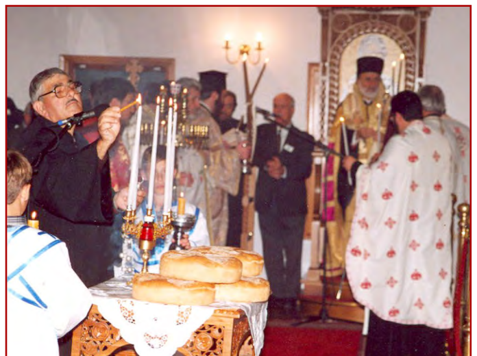
Εύλογία των άρτων κατά τόν Μ. Έσπερινόν τής Έορτής των Άγιων Άποστόλων Πέτρου και Παύλου χοροστατούντος του Σεβασμ. Αρχιεπισκόπου μας κ.κ. Στυλιανού (Sutherland 28-6-03).

This, in any case, is the meaning of the verse "God chose what is weak in the world to shame the strong" (1 Cor 1:27).