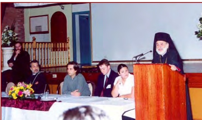
Ό Σεβασμιώτατος Αρχιεπίσκοπος κ.κ. Στυλιανός μετά τήν τέλεισιν του Άγιασμού Ένάργεως των εργασιών του 8ου Πολιτειακού Συνεδρίου Νεολαίας στο Σύννεϋ, ώμίλησε Έλληνιστί και Άγγλιστί ώς προς τήν έπικαιρότητα των υπό ανάπτυξη θεμάτων, ταυτότητας και έτερότητας σε μία πλουραλιστική κοινωνία (11-10-03).

τήν προθυμία και ειλικρίνειάν των νά συνεχισθούν έν αδελφική κατανοήσει αι μέχρι σήμερα αγαθαί σχέσεις, τάς όποίας καλλιέργησε επί 20 και πλέον έτη ό διμερής θεολογικός Διάλογος.