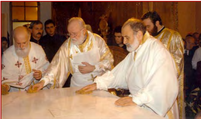
Στιγμιότυπα από τά έγκαινία του Ίερού Ναού Ύπαπαντής του Κυρίου Coburg (Βικτώρια 19-10-03).