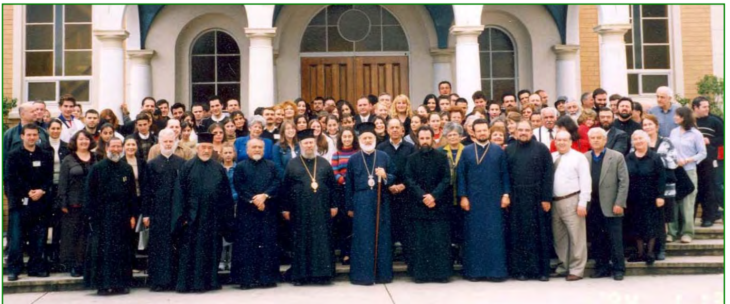
Ἀναμνηστικὴ φωτογραφία τῶν Συνέδρων τοῦ 8οῦ Πολιτειακοῦ Συνεδρίου Νεολαίας στήν Νότιο Αὐστραλία μετά τοῦ Σεβασμιωτάτου Ἀρχιεπισκόπου μας κ.κ. Στυλιανού, τοῦ Θεοφ. Ἐπισκόπου Δορυλαίου κ. Νικάνδρου καί τῶν Κληρικῶν (Ἀδελφίδα 3/4-10-03).

–Ἐχοροστάτησε καί ἐκήρυξε εἰς τόν Ἱερό Ναόν Ὑπα-