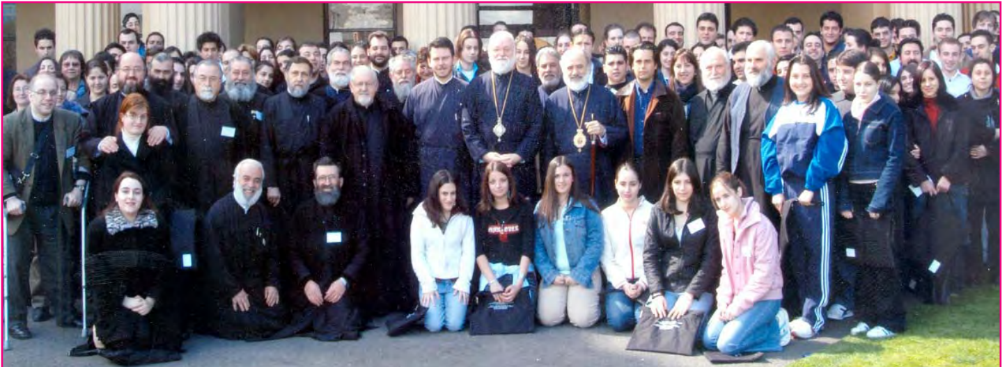
Στιγμιότυπα ἀπὸ τὸ 8 ο Πολιτειακὸ Συνέδριο Νεολαίας στὴν Βικτώρια. Ἄνω: Ἀπὸ τὴν τελετὴν Ἐνάρξεως τοῦ Συνεδρίου εἰς τὸν Ἱερόν Ναόν τοῦ Ἁγίου Εὐσταθίου South Melbourne. Εἰς τὸ μέσον: Ὁ Σεβασμιώτατος Ἀρχιεπίσκοπος κ.κ. Στυλιανός καὶ ὁ Θεοφ. Ἐπίσκοπος Δέρβης κ. Ἰεζεκιήλ μετὰ τοῦ Ἀρχιδικαστοῦ τῆς Βικτωρίας κ. John H. Phillips μετὰ τῆς συζύγου του, ὁ ὁποῖος ἐκήρυξε τὴν ἐπίσημον ἑναρξιν τῶν ἐργασιῶν τοῦ Συνεδρίου. Κάτω: Ἀναμνηστικὴ φωτογραφία τῶν Συνεδρῶν (28-9-03).

κοῦ μαθήματος στὰ Δημόσια Σχολεῖα (2-9-03).