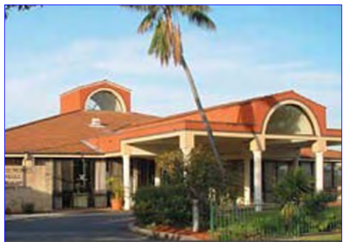
St. Basil's Homes Sydney.