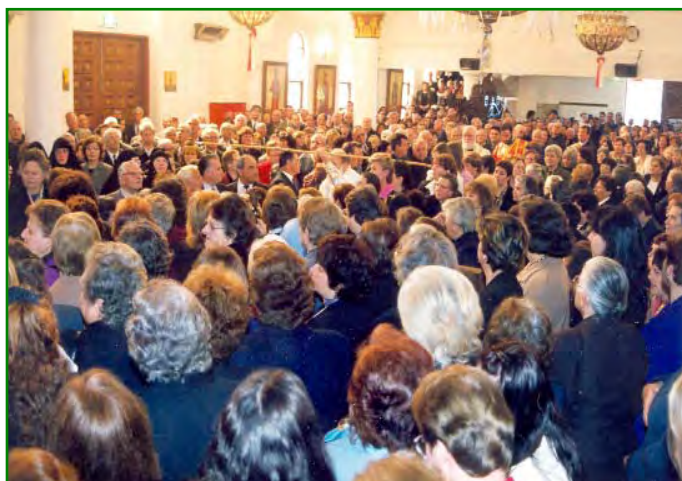
Στιγμιότυπα από τά εγκαινία του Ήρου Ναού Άγ. Παρασκευής St. Alban's Βικτωρίας, τελεσθέντα υπό του Σεβασμιωτάτου Άρχιεπισκόπου Αύστραλίας κ.κ. Στυλιανού (28-9-03).