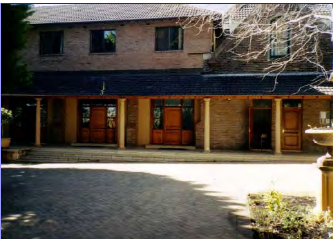
St. Andrew's Theological College.